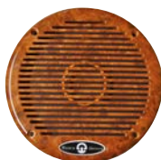
Radica / Briar-root