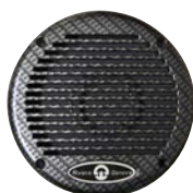
Carbonio / Carbon