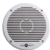
Bianca / White