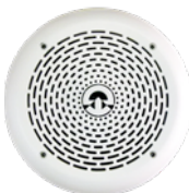
Bianca / White