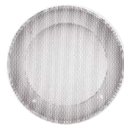
Metallo solo al coperto Metal only for cabin in dor