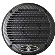
Carbonio / Carbon