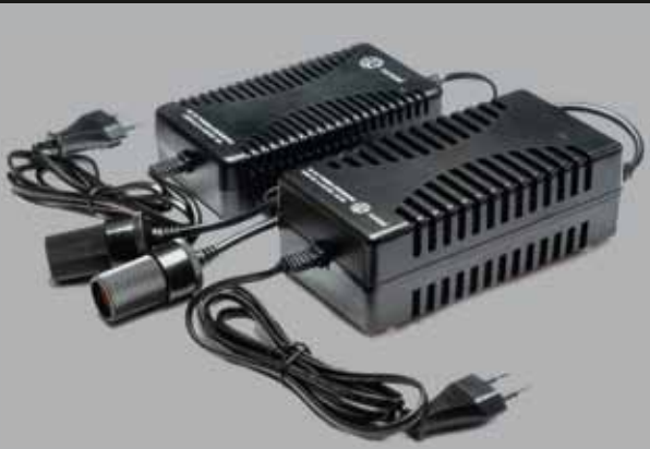
ACDC™ Series - XUNZEL