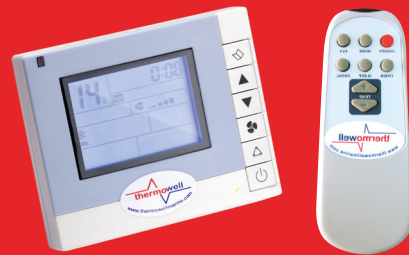
Comando digitale a parete e telecomando Digital wall mounted and remote controllers