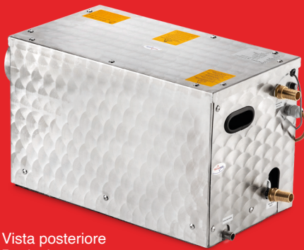
Vista posteriore Back view

Climatizzatore in kit montaggio fai da te DIY kit air conditioner 9.000 - 13.000 - 16.000 BTU/h